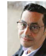
FOUAD SIDALI wethouder Culemborg